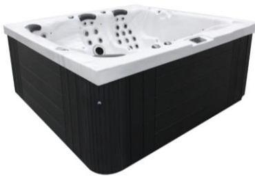
Spa de moins de 2 000 litres

Les spas de nage , sont inclus à la fiche informative sur les piscines creusées, puisqu'un permis est nécessaire.