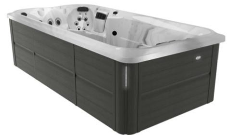
Spa de nage (+ de 2 000 litres)